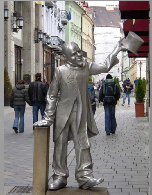
Socha Schöne Náciho